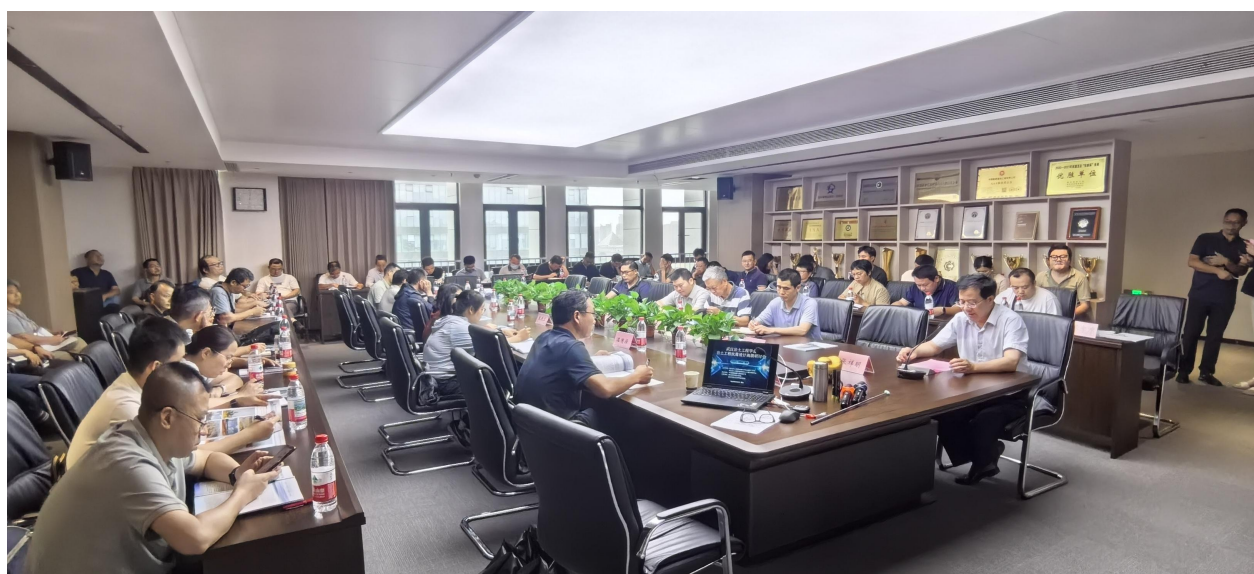
“岩土工程抗震设计高级研讨会”成功举办 行业相关专家及技术人员共计 71 人

会场座无虚席，结合最新国家规范，密切联系工程实际，由浅入深，图文并茂，内容丰富，大家受益匪浅。